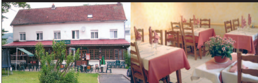
Le Robinson à Haybes