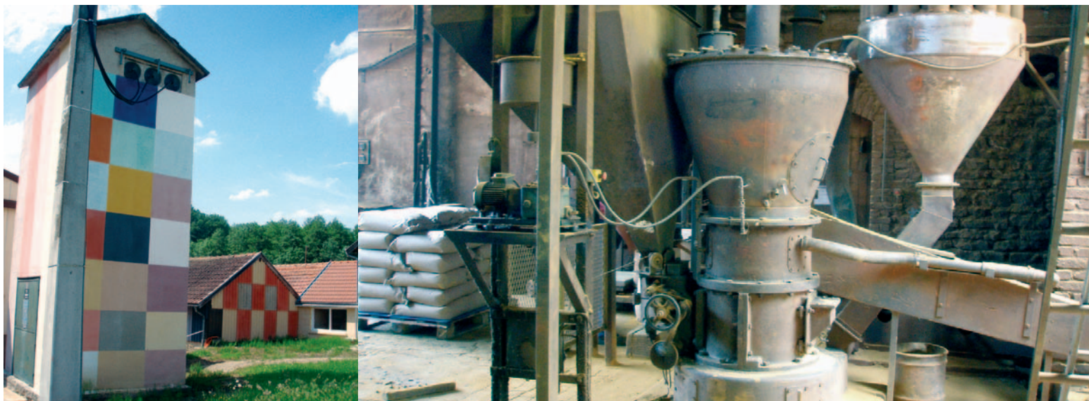
L'ancien transformateur du hameau sert de nuancier de démonstration. Les couleurs les plus vives sont obtenues en mélangeant divers produits.