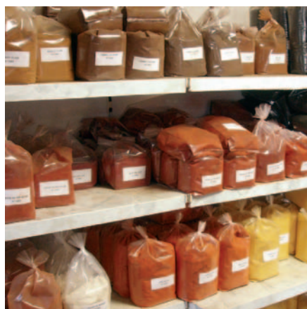
Des dizaines de teintes obtenues en séchant ou en calcinant

Cette entreprise de 7 salariés installée à Ecordal a étoffé son catalogue de clients et développé son image de marque en participant l'an passé au salon Artisan'Art dans la capitale belge.