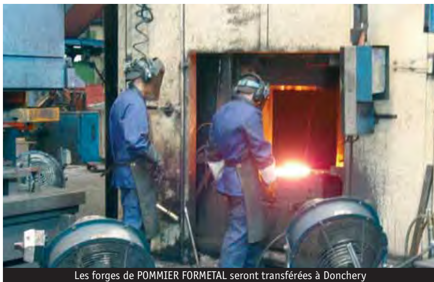
Les forges de POMMIER FORMETAL seront transférées à Donchery

Contact : Pommier Formetal rue de Napont, 08700 Neufmanil tél : 03 24 53 67 57 mail : jean-luc.pigeot@pommier.fr