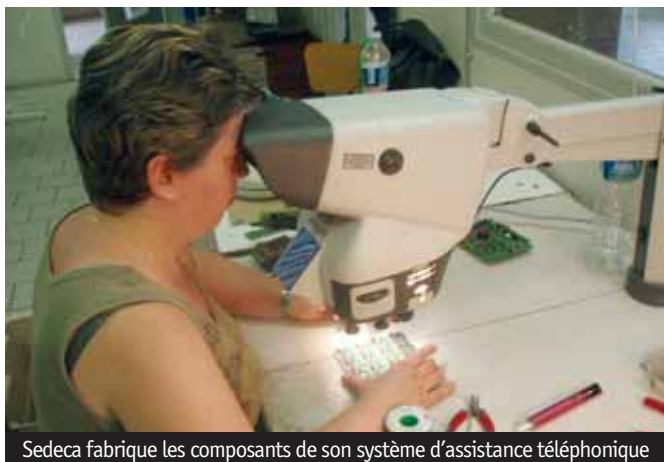
Sedeca fabrique les composants de son système d'assistance téléphonique

Sedeca Electronique qui a réalisé l'an passé 3,2 M € de chiffre d'affaires (fabrications et mises en services), fabrique chaque mois quelque 2 400 appareils d'aide au maintien à domicile de personnes dépendantes et âgées. Ces appareils sont destinés au marché français. Ils sont utilisés par de nombreuses associations d'aide à domicile des personnes dépendantes agréées par les Conseils généraux.