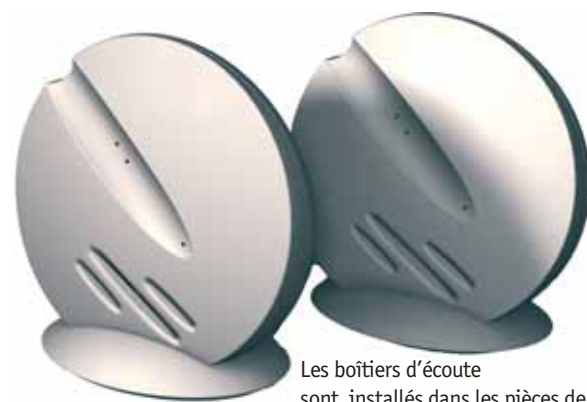
Les boîtiers d'écoute sont installés dans les pièces de vie

Cette PME installée à Signy-le-Petit et qui emploie six salariés* fabrique et installe, chez les personnes âgées ou dépendantes, un système d'assistance téléphonique à leur vie quotidienne. Un service à la personne en pleine expansion.