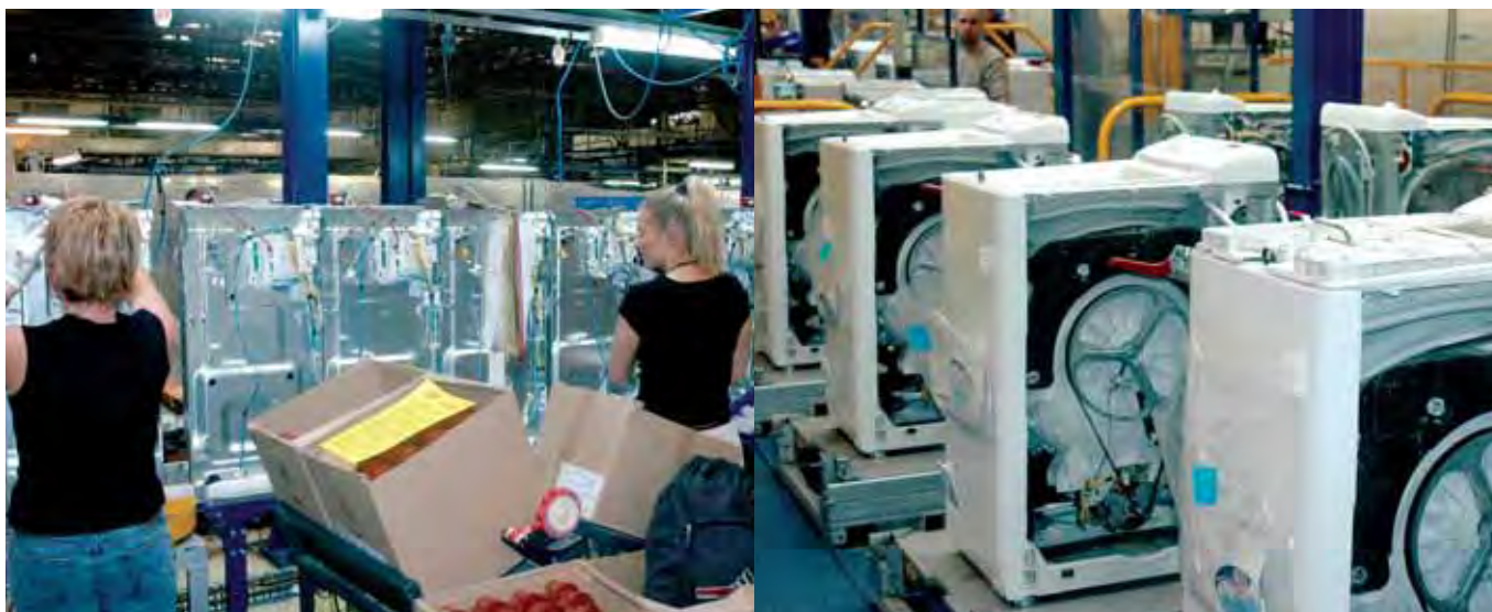
Le site industriel d'Electrolux à Revin est spécialisé dans la fabrication de lave-linge se chargeant par le haut.

“Nous produisons 280 modèles de lave-linge à chargement par le dessus, 280 modèles dans 15 marques différentes distribuées dans 38 pays”, souligne Régis Chainot. Le modèle « Top », quelle que soit sa marque, n'est pas encombrant avec ses 40 cm de large et ses 60 cm de profondeur (ou 85 cm de haut). Il est facile à loger et très ergonomique. C'est en Europe et particulièrement en France et en Allemagne que se concentre le plus grand nombre de foyers de consommateurs.