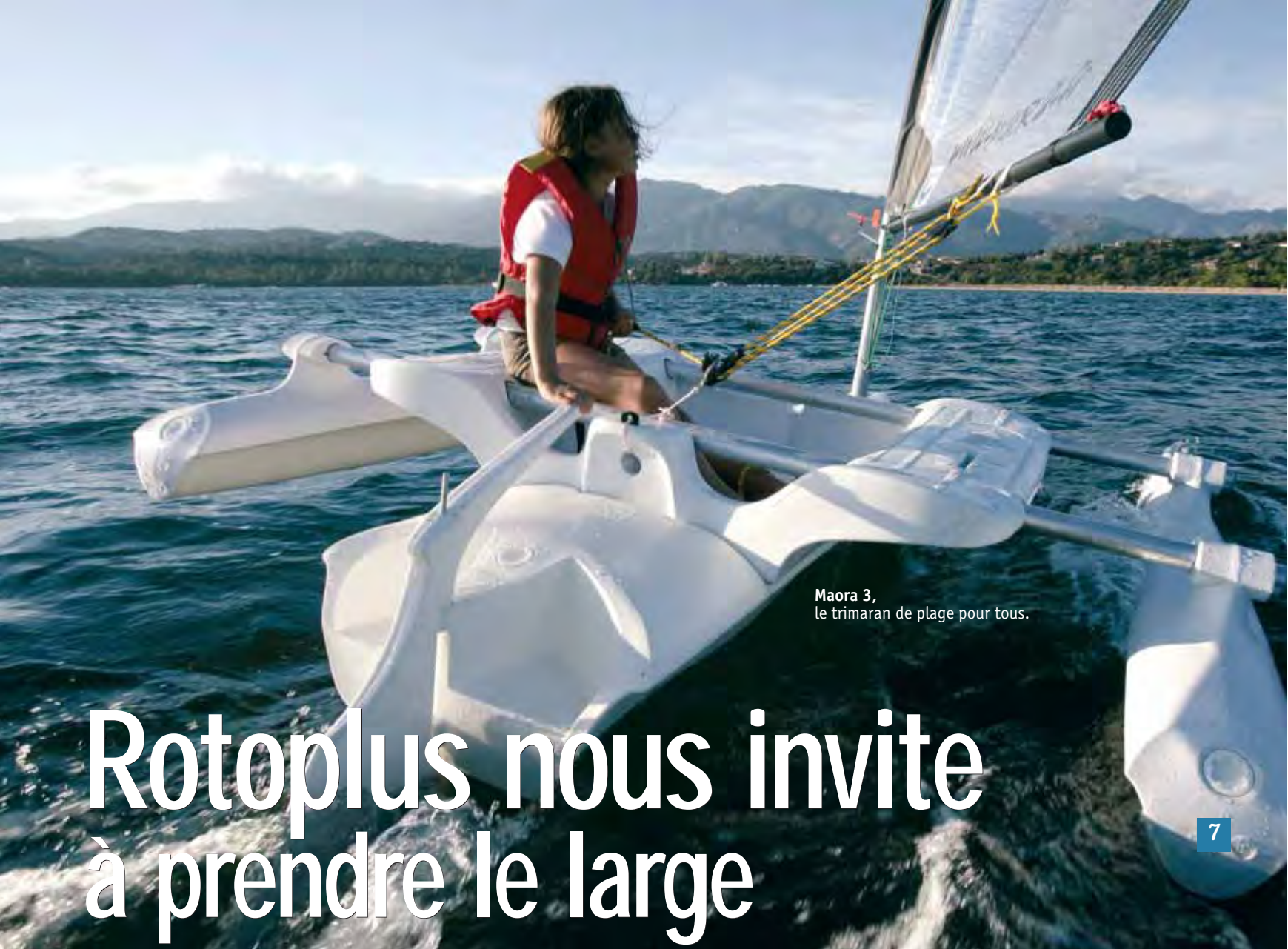
Maora 3, le trimaran de plage pour tous.