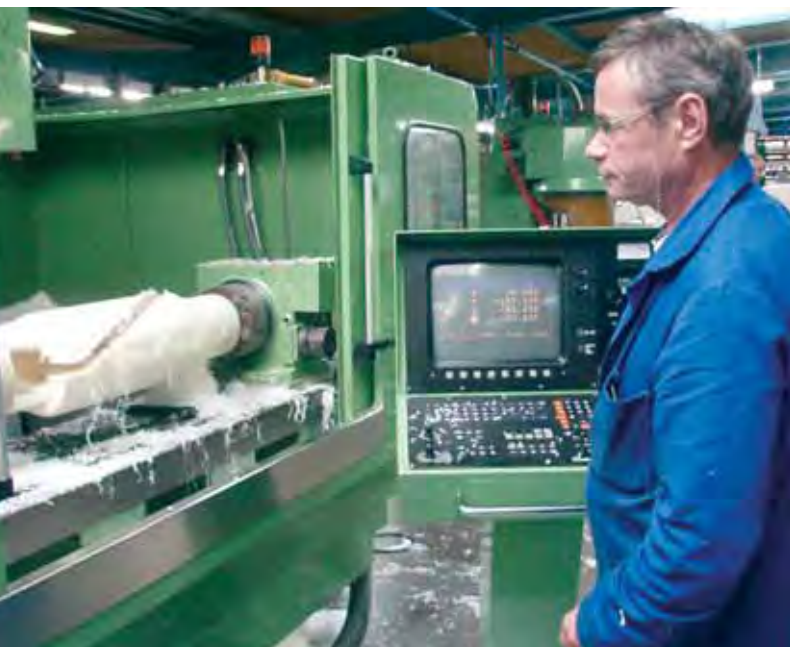
équipant les lignes de convoyage et de conditionnement des usines.